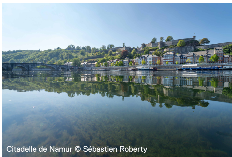
Citadelle de Namur

La Citadelle* 1 de Namur se situe sur une colline au confluent de la Sambre et de la Meuse. Cette position stratégique, au carrefour de plusieurs voies de communication, a fait d'elle une place forte importante en Europe. Son rôle était de défendre et de surveiller ce point de passage. Elle a dès lors été un objet de convoitise au fil des siècles.